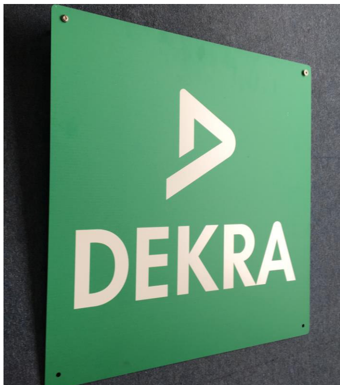
Targa «da Ingresso» (60x60)