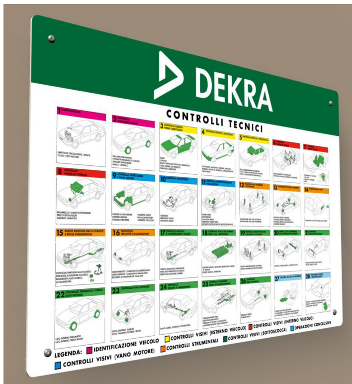
Targa «interventi» (50x74)